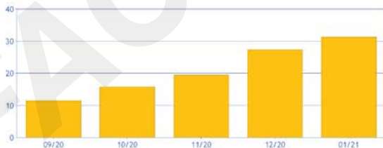
I tuoi consumi negli ultimi 12 mesi