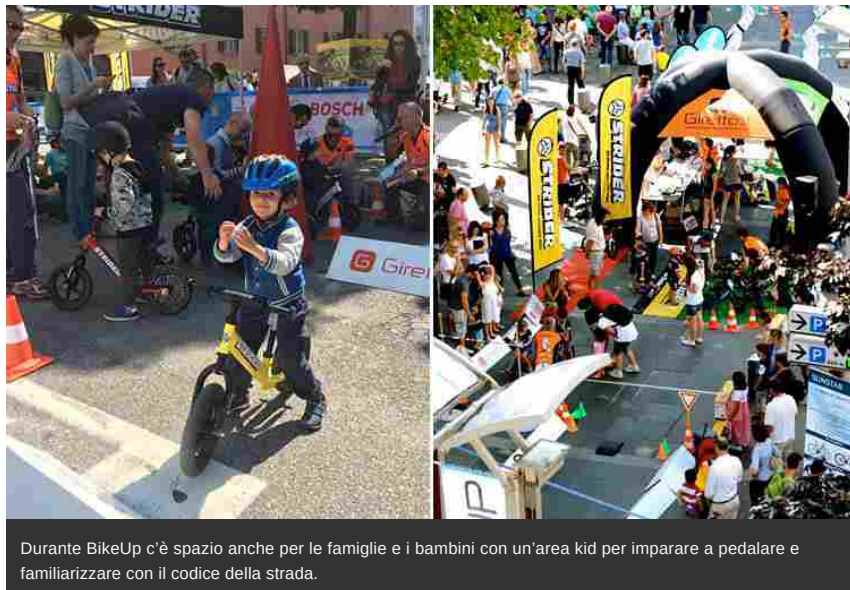
Durante BikeUp c'è spazio anche per le famiglie e i bambini con un'area kid per imparare a pedalare e familiarizzare con il codice della strada.

Presente infine l' Area Cicloturismo , in cui sarà possibile conoscere i maggiori attori del settore provenienti da tutta Italia: tour operator, guide mountain bike, noleggiatori, bike hotel e altro ancora al servizio dei viaggi in sella alla bicicletta elettrica.